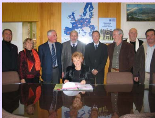
Bilan de la charte de l'environnement au Conseil Général le 3 octobre: le 04 a été