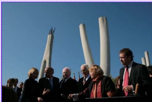
Inauguration de l'école internationale ITER à Manosque le 10 octobre 2008. La contribution de l'État s'élève à 502 millions d'Euros.

L'État est un acteur dynamique dans le 04. Il est un partenaire actif pour le développement économique, social et culturel de notre département. Au service de nos concitoyens, il apporte, en outre, son soutien, son expertise et son aide aux collectivités territoriales.