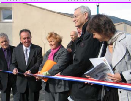
Inauguration de logement sociaux à Annothe le 21 novembre. L'État a financé plus de 26% du budget.