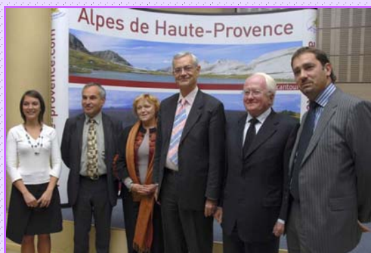
Inauguration centre culturel Paul RETY à Oraison le 17 octobre: la contribution de l'État représente 40% du budget des travaux.