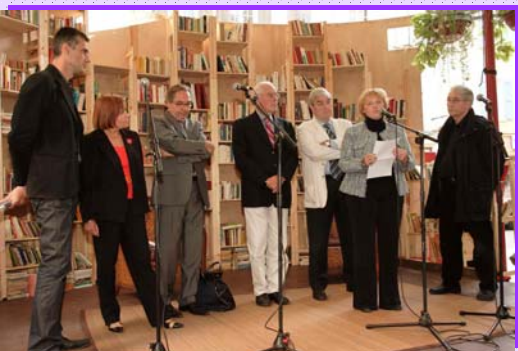
Inauguration du festival des « des correspondances à Manosque.