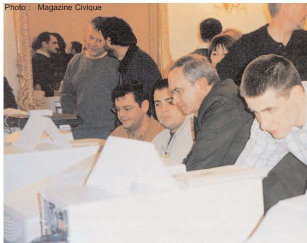
Salon de sites publics Internet à Digne-Les-Bains le 14 décembre 2000