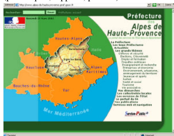
Page d'accueil du site internet de la Préfecture accessible depuis le 3 avril dernier

démarches les plus courantes (cartes grises, permis de conduire, permis de chasser...), l'accès aux autres services de l'Etat, une fonction de site portail en orientant l'utilisateur vers d'autres sites institutionnels et, enfin, les publications des services de l'Etat (périodiques, rapports, plans...).