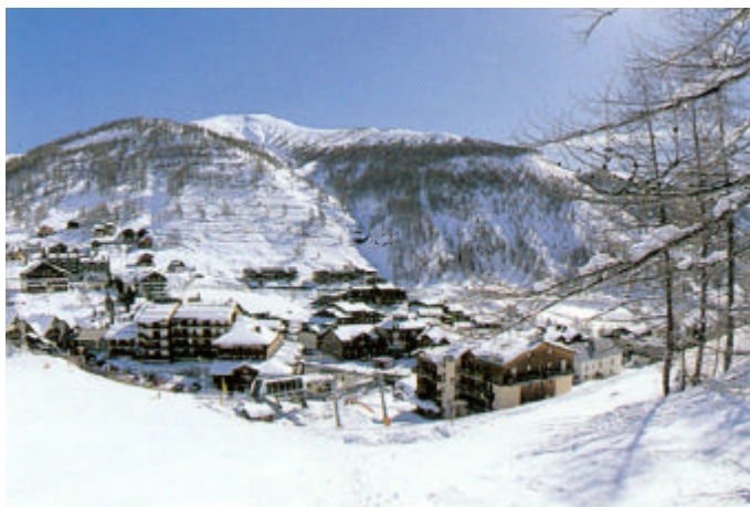
Accroître la polyvalence des saisonniers du tourisme afin de pallier les difficultés en cas d'absence d'enneigement, telle est la finalité recherchée par l'Etat et ses partenaires

Depuis le 3 mai 2002, 15 saisonniers du Val d'Allos ont débuté une formation "ouvrier polyvalent de montagne", organisée par le GRETA et financée par l'Etat et le Conseil Général. Cette formation se déroulera en 2 temps, correspondant aux intersaisons. Les stagiaires alterneront période de formation et période d'emploi saisonnier. Deux formations de ce type, destinées à diversifier les qualifications des saisonniers, ont déjà été organisées au profit de saisonniers de la vallée de l'Ubaye.